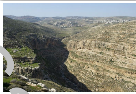
Pictured above are the cliffs of הַשֵּׁן הָאֶחָד מִצִּוּק מִצְפוֹן מוֹל מְכַמֵּשׁ and הָאֶחָד מִנֶּגֶב מוֹל גִּבְעָה with the ravine in between.