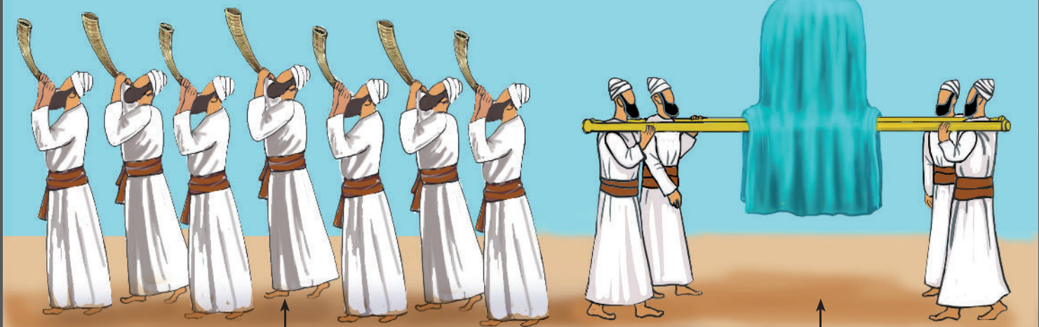
2. "וְשָׁבְעָה כֹהֲנִים יִשָּׂאוּ שְׁבָעָה שׁוֹפְרוֹת יִזְבְּלוּ לְפָנֵי אֲרוֹן ה'" (ו')