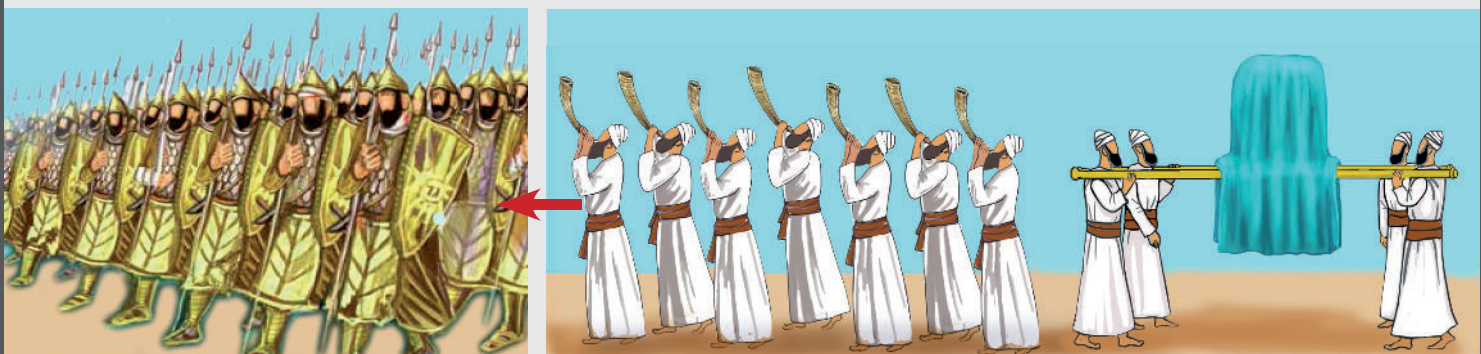
4. "וְהִחְלוּץ יַעֲבֹר לְפָנֵי אֲרוֹן ה' ... וְהִחְלוּץ הַלָּוִי לְפָנֵי הַפְּהֲנִים" (ו', ב')