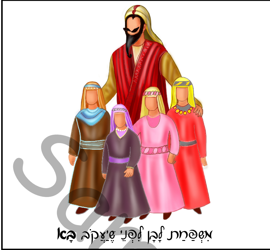
אַשְׁפַּחַת לְבָן עֵינַי שְׂצִקָה בָּא