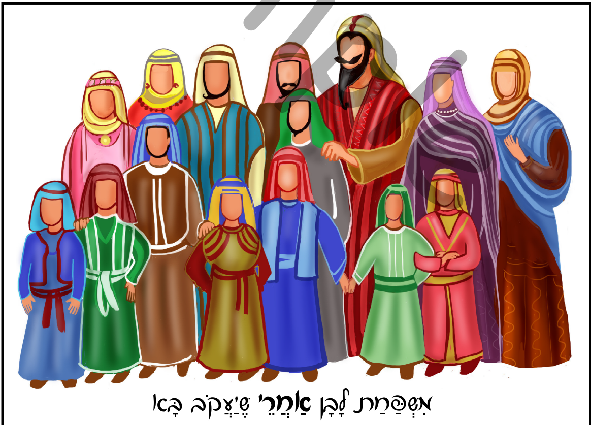
אַשְׁפַּחַת לְבָן אֵימִרִי שְׂצִקָה בָּא