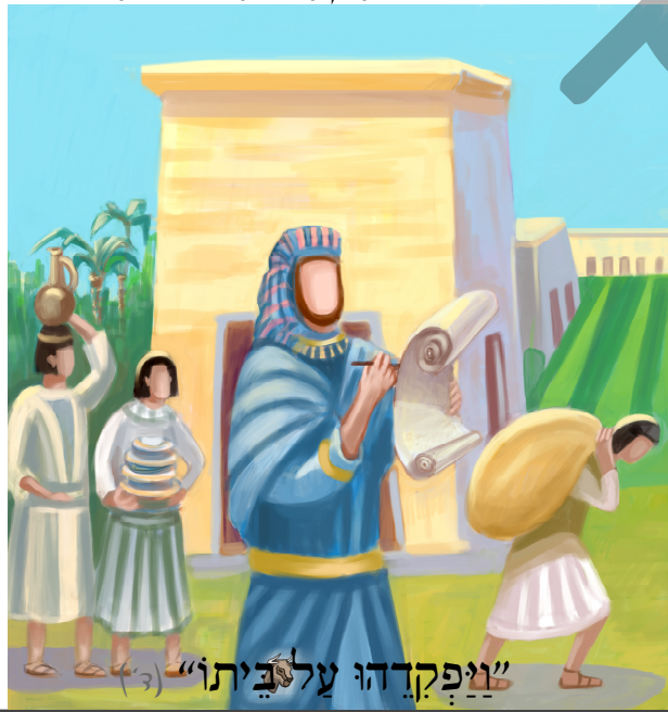
"וַיִּפְקְדֵהוּ עַל בֵּיתוֹ" (3)