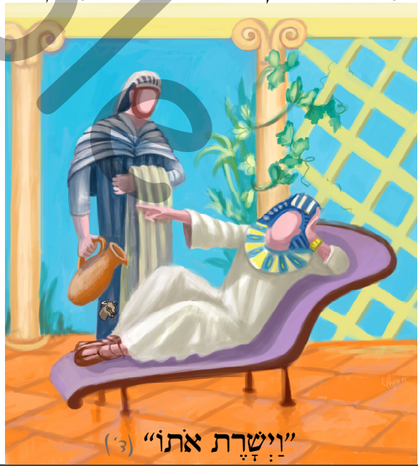
"וַיִּשְׁרַת אֹתוֹ" (3)